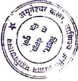
Principal Amruteshwar Arts, Commerce & Science College, Vinzar, Tal. Velha, Dist. Pune.

Ref: V.C. Note no. B 27 PA/27/2020 Dated 23/05/2020